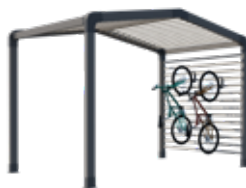
Range-vélos et/ou stockage