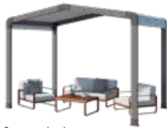
Espace de détente