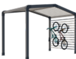
Range-vélos et/ou stockage

Sas d'entrée, espace détente ou de stockage, chambre indépendante, les modul'homes s'adaptent aussi bien aux mobil-homes 1 pente que 2 pentes. Ils peuvent se positionner en pignon, comme un sas ou détachés du mobil-home.