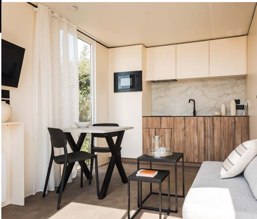
Cocina con placa de inducción de 2 fuegos opcional y microondas integrado

Mueble de lavabo suspendido de 90 cm de ancho con almacenamiento y toallero integrado