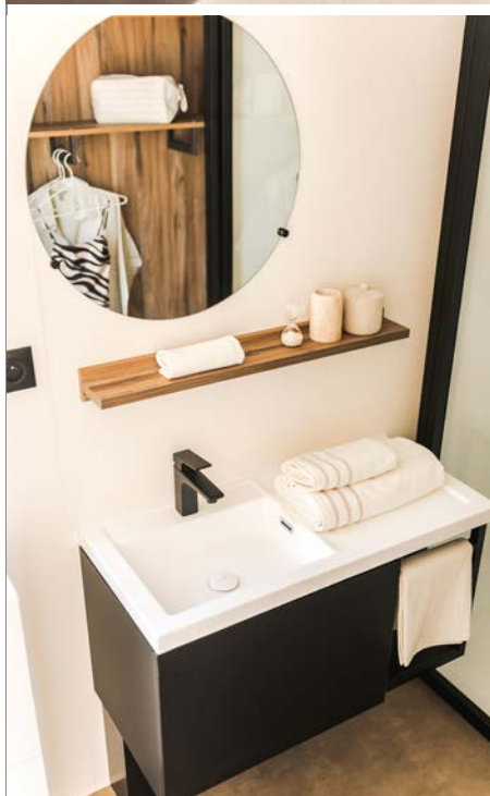
Estantería con espejo redondo WC suspendido con cisterna de doble descarga