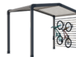
Fietsenstalling en/of opslag

Voorportaal, relax- of opslagruimte, aparte slaapkamer: de modul'homes kunnen zowel met stacaravans met een dak met 1 hellend vlak als 2 hellende vlakken worden gecombineerd.