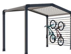
Range-vélos et/ou stockage

Sas d'entrée, espace détente ou de stockage, chambre indépendante, les modul'homes s'adaptent aussi bien aux mobil-homes 1 pente que 2 pentes. Ils peuvent se positionner en pignon, comme un sas ou détaché du mobil-home.