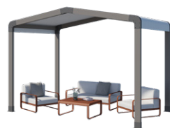
Espace de détente