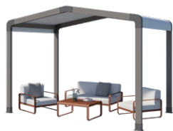
Espace de détente