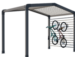
Range-vélos et/ou stockage

Sas d'entrée, espace détente ou de stockage, chambre indépendante, les modul'homes s'adaptent aussi bien aux mobil-homes 1 pente que 2 pentes. Ils peuvent se positionner en pignon, comme un sas ou détaché du mobil-home.