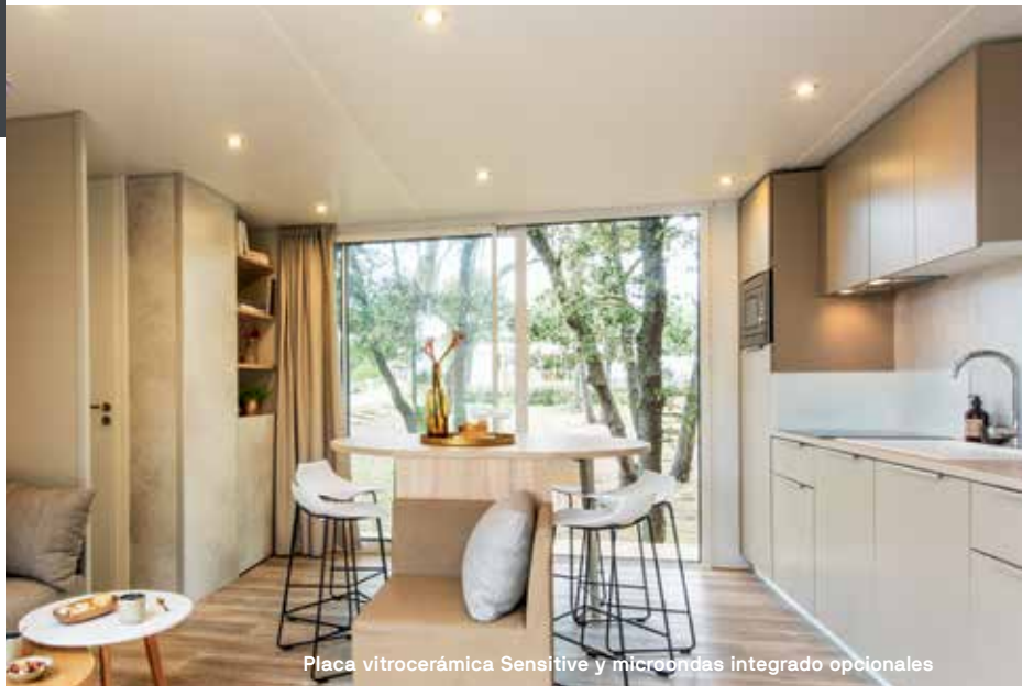
Placa vitrocerámica Sensitive y microondas integrado opcionales